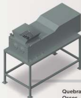
Quebrador de Ossos