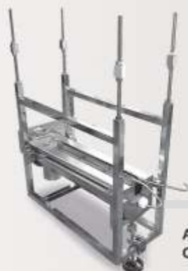
Arrancador de Cabeças de Frango