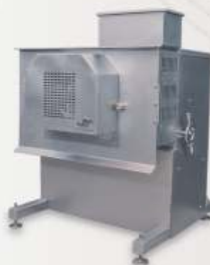
Recuperadora de Carne