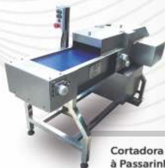
Cortadora de Frango à Passarinho