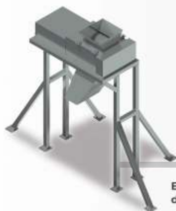
Esmagador de Carcaça