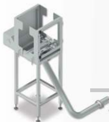
Tirador de Pele do Pescoço