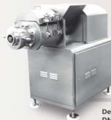
Desossador Mécânico DMJR (CMS Aves)