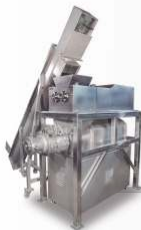
Desossador Mécânico DMJR (CMS Suíno)