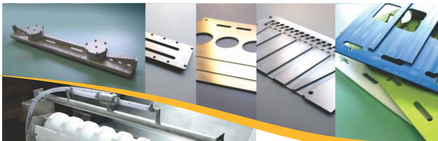
Máquina para enrolar kibes e almôndegas