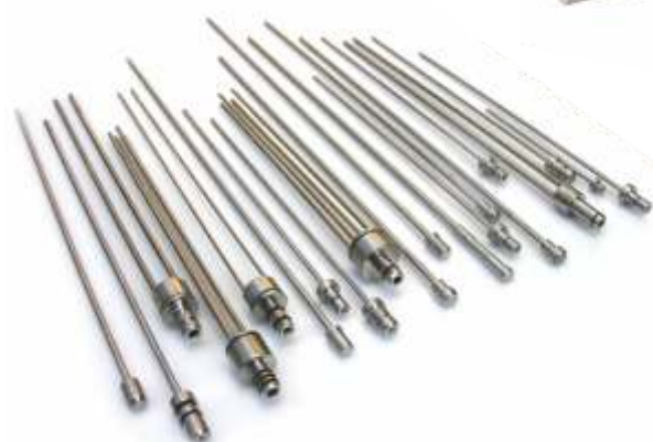
Agulhas para máquinas injetoras de tempeiros de diversos modelos