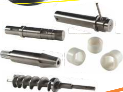
Peças de reposição para moedores em geral