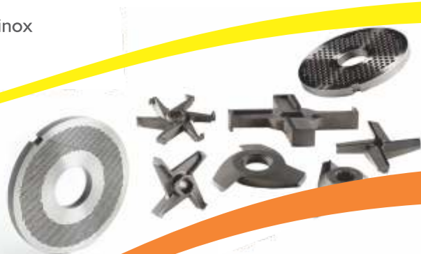
Discos perfurados e navalhas para moedores