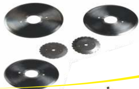
Discos de corte em aço inox para máquinas de corte de diversos modelos