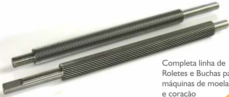
Completa linha de Roletes e Buchas para máquinas de moela e coração