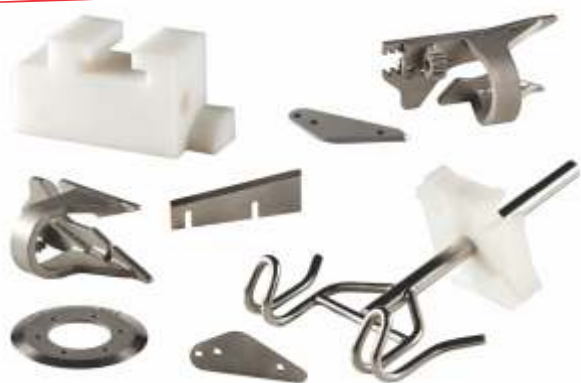
Lâminas de corte e peças de reposição para linhas de corte automático