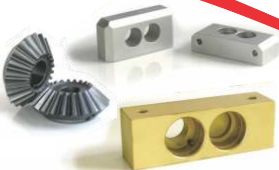
Peças de reposição para máquinas de moela e coração de diversos modelos