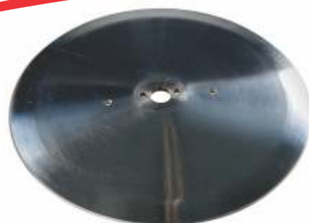
Discos de corte para diversos modelos de máquinas fatiadeiras