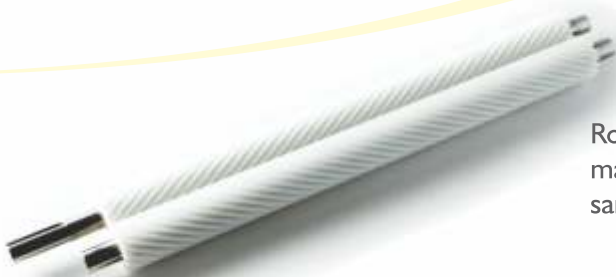
Rolos dentados para máquinas de retirar penas de sambiqueira de frangos